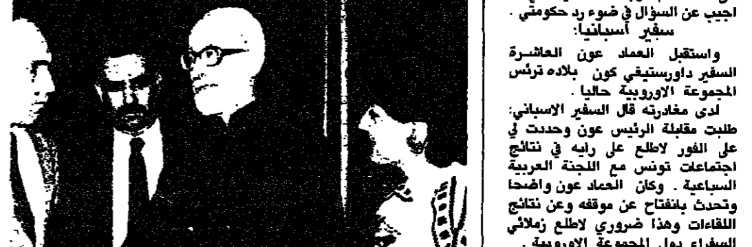
ابي نادر مغاربا بعيدا

استقبل رئيس مجلس الوزراء العماد ميشال عون عند الساعة الرابعة من بعد ظهر أمس في قصر بعيدا، بطريق اليوم الكاثوليك مسكيسون الخامس.